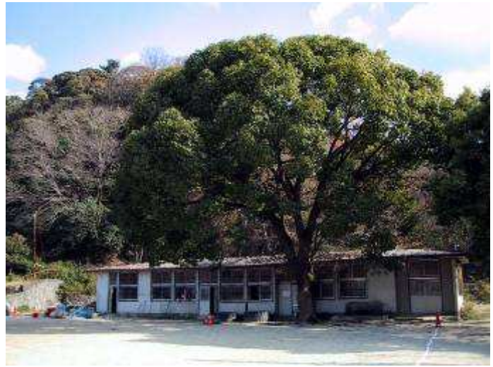
平成 13 年 (2001 年) 1 月 1 日 OB 戦