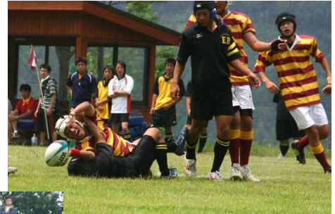
↑平成17年6月19日四国選手権決勝 徳島城東戦②