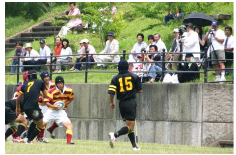
↑平成17年6月19日四国選手権決勝徳島城東戦①