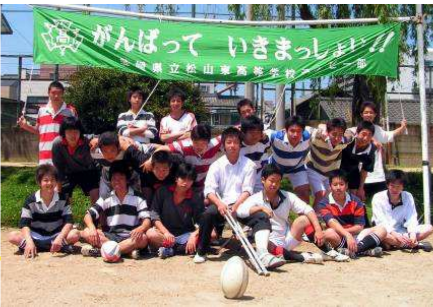
平成 17 年 (2005 年) 6 月 19 日 四国大会 B ブロック 11 回目の優勝 (本文 p168) OB & 父兄会の方々と 久万高原ラグビー場