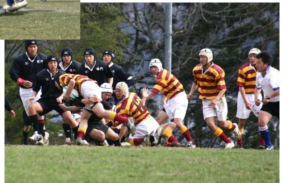
↑平成17年3月27日第12回久万町長杯鳴門戦