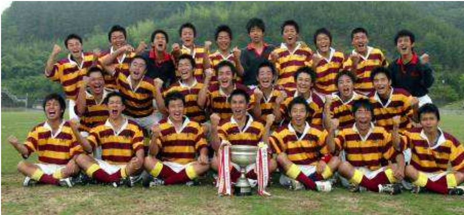
平成 15 年 (2003 年) 6 月 15 日 四国大会 A ブロック 12 年ぶり 3 回目の優勝 (本文 p43, 168) 徳島市球技場