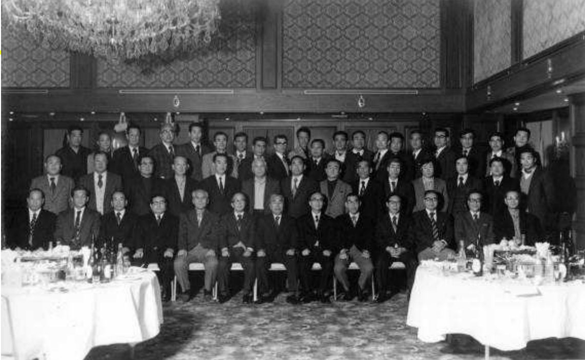
昭和 52 年 1 月 15 日 OB 会 伊予鉄会館