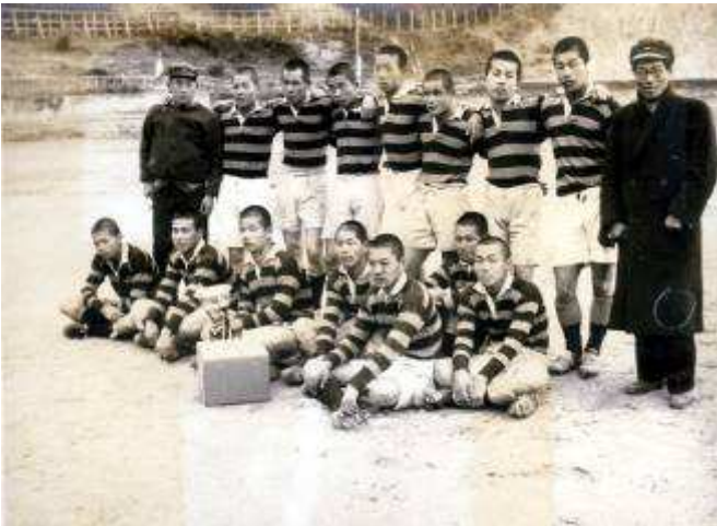
昭和12年(1937年)12月5日 全国中等大会県予選優勝(本文 p18) 道後グラウンド