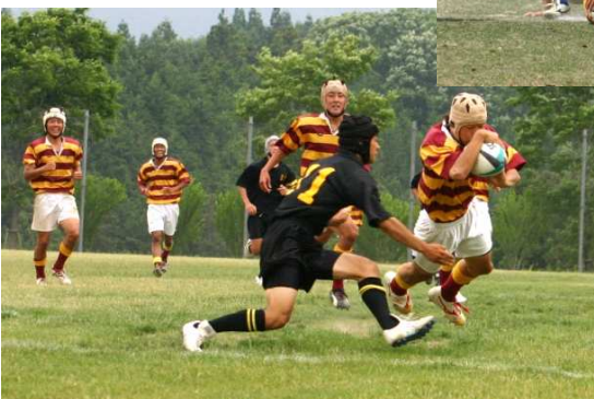
↑平成17年6月19日四国選手権決勝徳島城東戦⑤