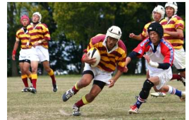
↑平成17年4月17日四国予選 準々決勝中予合同戦①