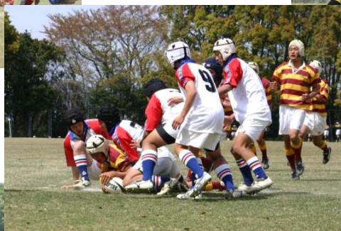
←平成17年4月17日四国予選 準々決勝中予合同戦②