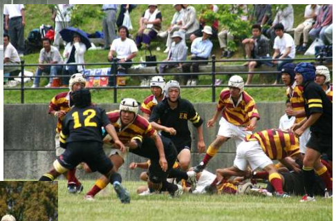
↑平成17年6月19日四国選手権決勝 徳島城東戦④