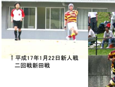
↑平成17年1月22日新人戦 二回戦新田戦