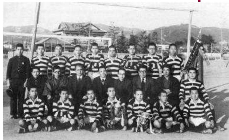
昭和13年度(1938年度) 第21回全国中等大会に初出場を果たした松山中学チーム (本文 p15)