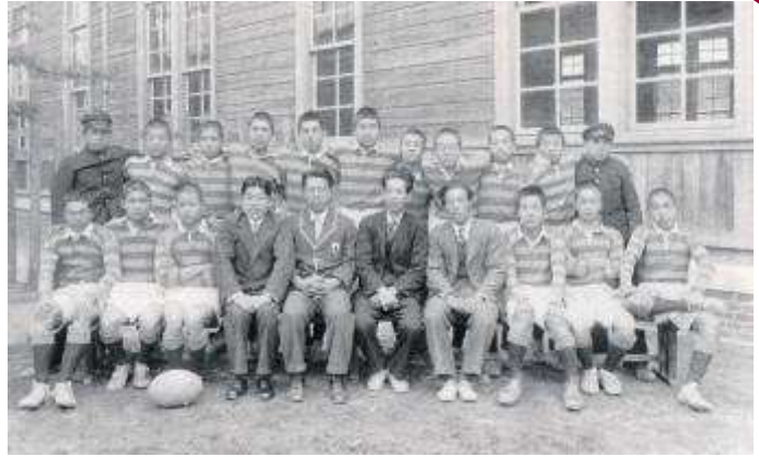
昭和7年(1932年)創部時 (本文 p111)