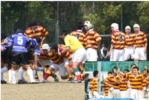
↑平成18年4月8日第54回四国予選 八幡浜戦