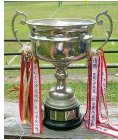
四国大会 B ブロック優勝カップ S56 と H14 のリボンが見える