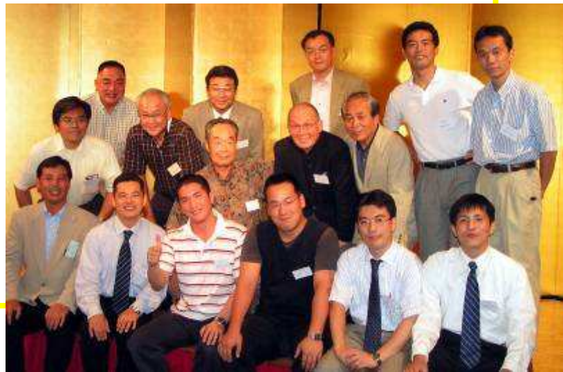
平成 16 年 8 月 1 日 同窓会関東支部総会 (本文 p104)