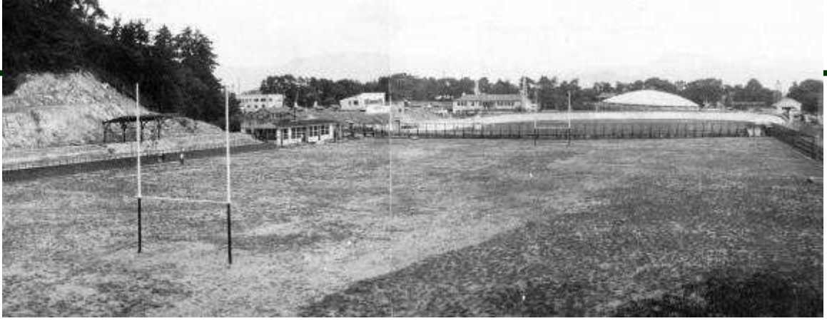
堀之内 県営ラグビー場 (本文 p197)