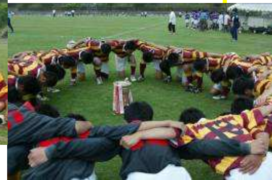
優勝カップを中心に 『がんばっていきましょい』