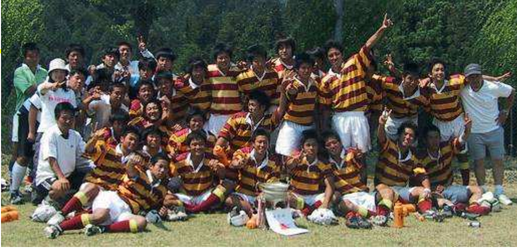
平成 14 年 (2002 年) 6 月 16 日 四国大会 B ブロック 21 年ぶり優勝 (本文 p40) 久万高原ラグビー場