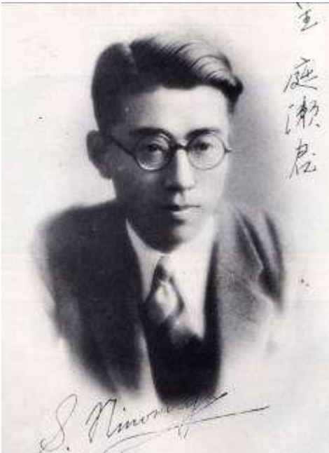
愛媛ラグビーの父 二宮晋二 (本文 p49, 111, 137)