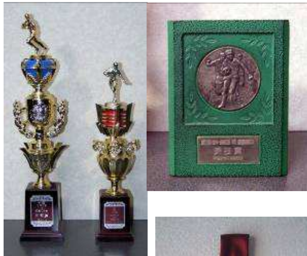
松中一師範定期戦トロフィー&盾