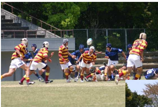
↑平成17年4月29日第53回四国予選 決勝新田戦