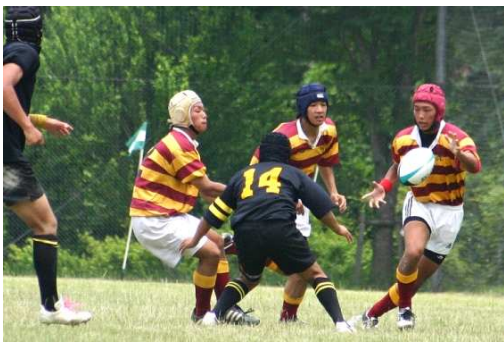
↑平成17年6月19日四国選手権決勝徳島城東戦③