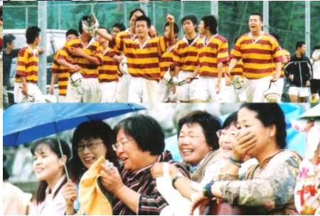
↑平成16年6月6日県総体松商に勝利し4強進出